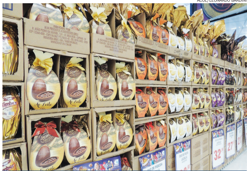
A diversidade de ovos lota os corredores dos supermercados, que oferecem uma grande variedade de opções para o consumidor

Em uma matéria apresentada no G1, uma feira promovida em São Paulo no dia 23 de fevereiro para mostrar as novidades, a Associação Brasileira da Indústria de Chocolates, Cacaú, Amendoim, Balas e Derivados (Abicab) novamente aposta na tradição do brasileiro de dar ovos de presente e se diz otimista este ano, com a retomada da economia. A ACIL deseja a todos que esta Páscoa aflore ainda mais o sentimento de união e fraternidade entre as pessoas, e é claro, muitos chocolates a todos.