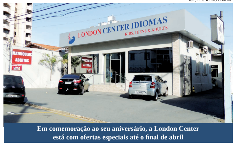
Em comemoração ao seu aniversário, a London Center está com ofertas especiais até o final de abril

A London Center em comemoração aos 20 anos de atuação,