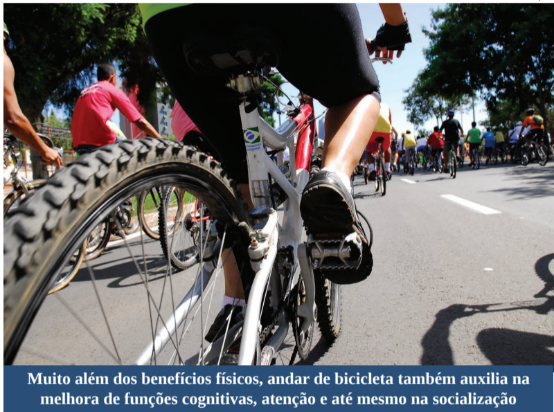
Muito além dos benefícios físicos, andar de bicicleta também auxilia na melhora de funções cognitivas, atenção e até mesmo na socialização

Andar de bicicleta é uma das atividades mais apreciadas pelas pessoas. Desde muito cedo o ciclismo é apresentado às crianças, e a prática desta atividade traz inúmeros benefícios tanto para o corpo quanto para a mente. Pedalar é considerado por muitos muito mais que uma atividade física, mas sim um estilo de vida.