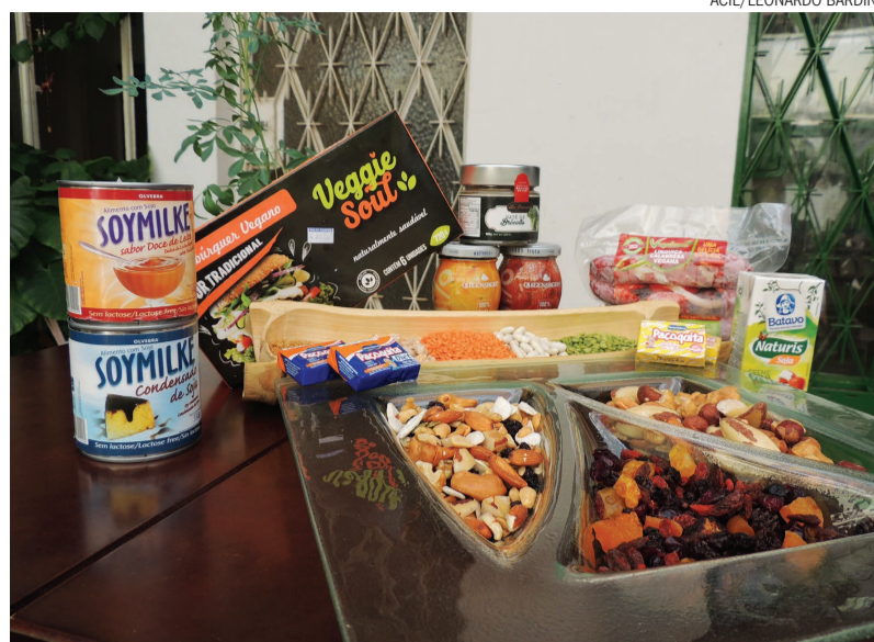
A diversidade de produtos sem qualquer origem animal é imensa, e a cada ano este mercado cresce consideravelmente